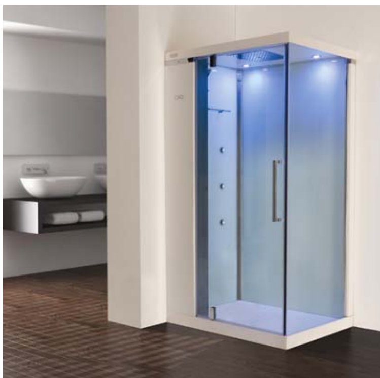
Cabine hydro-hammam intégrale - Modèle Tango