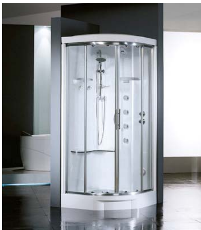
Cabine hydro-hammam intégrale –Modèle Infinity 120

Lorsque l'on manque de place chez soi pour l'installation d'un hammam, il existe des cabines qui proposent la douche et le hammam dans le même espace : les cabines hydro-hammam.