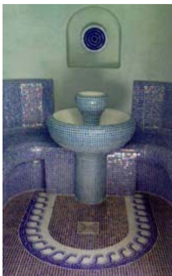
Exemples de hammam réalisés par Lux Eléments SAS